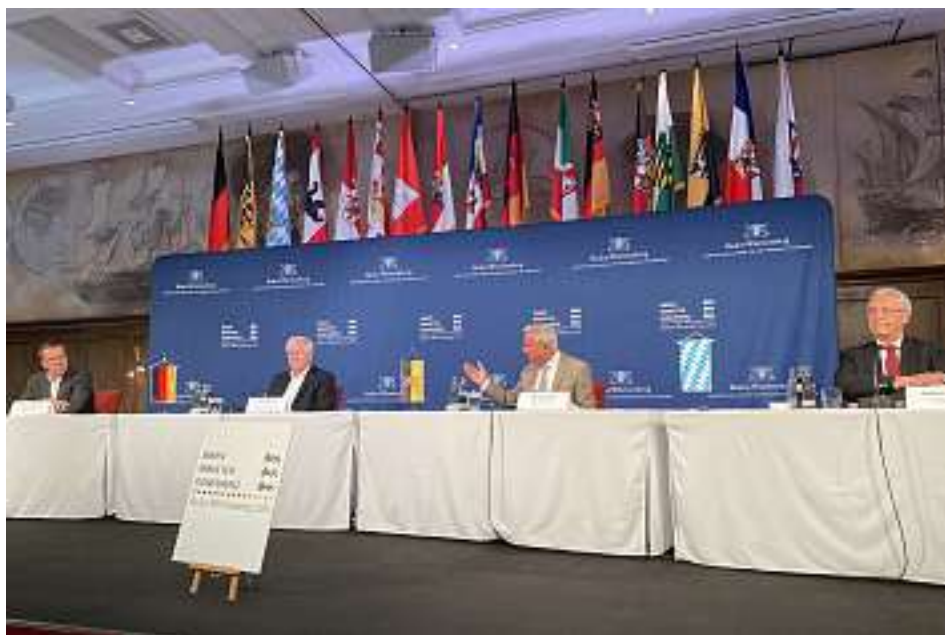
Die Innenminister Boris Pistorius (Niedersachsen, SPD), Horst Seehofer (Bundesinnenminister, CSU), Thomas Strobl (Baden-Württemberg, CDU) und Joachim Herrmann (Bayern, CSU) während der Abschlusspressekonferenz der IMK