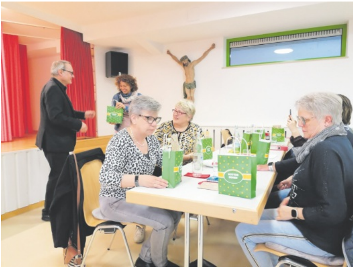
Geschenke für das Vorstandsteam

Das Kapitel Frauengemeinschaft Rust ist geschlossen.