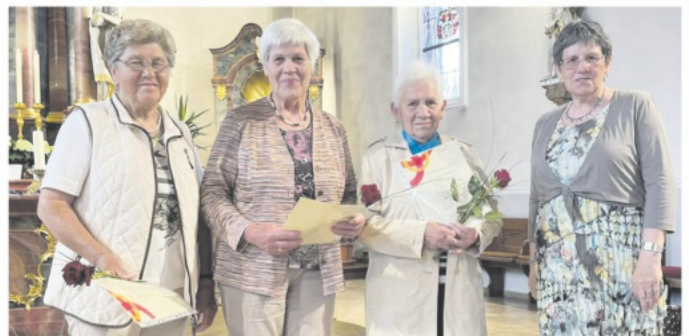
Ehrungen für 25 Jahre Mitgliedschaft (oben) und für 50 +1 Jahr Mitgliedschaft

Erstmalig 14 Frauen für 60 Jahre , sind alle am 04.03.1962 beigetreten: