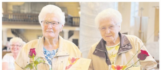
Ehrungen für 60 Jahre Mitgliedschaft