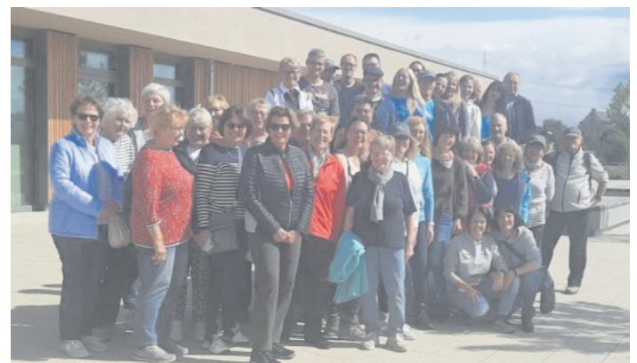
Impression vom Wandertag am 17. September